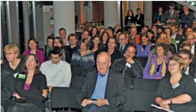
dm-Gründer Prof. Götz W. Werner (Mitte) eröffnet die Existenzgründungswoche 2010.

„münster gründet“ begrüßt im Jahr 2010 insgesamt 700 Teilnehmer. Die Woche für Existenzgründer und junge Unternehmen informiert zum Thema Selbstständigkeit, dient der Vernetzung und dem intensiven Erfahrungsaustausch. Initiator ist das Gründungsnetzwerk Münster, die Wirtschaftsförderung Münster GmbH koordiniert das Workshop-, Seminar- und Veranstaltungsprogramm. Highlights 2010 sind der Auftaktvortrag von dm-Gründer Prof. Götz W. Werner sowie die Vorstellung der erstmals veröffentlichten Bilanz zur guten Gründungsberatung in Münster.