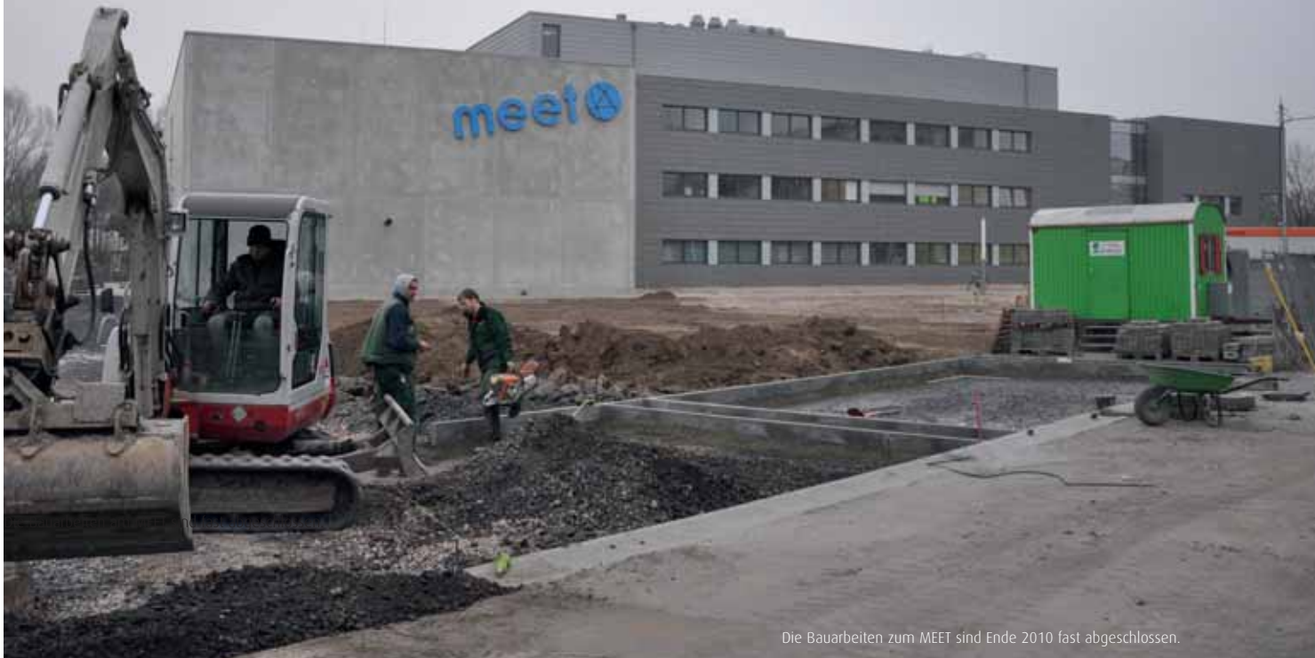
Die Bauarbeiten zum MEET sind Ende 2010 fast abgeschlossen.

Als Innovationsminister Prof. Dr. Andreas Pinkwart im Februar 2010 zum Batterietag NRW nach Münster kommt, wird 150 Experten aus Wissenschaft und Industrie die Dimension des Themas erneut bewusst: Die Energiespeicherung zur Etablierung der Elektromobilität zählt zu den großen Herausforderungen der Zukunft.