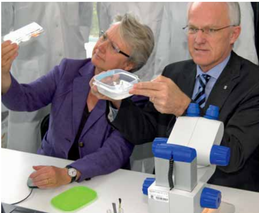
Stammzellforschung ist spannend: Bundesforschungsministerin Prof. Dr. Annette Schavan und der ehemalige NRW-Ministerpräsident Jürgen Rüttgers in einem MPI-Labor.

Im CARE soll die Entwicklung der so genannten IPS-Technologie mit großen Schritten vorangetrieben werden. Hierbei werden Körperzellen in einen embryonalen Urzustand zurückprogrammiert. Die so gewonnenen induzierten pluripotenten Stammzellen sind – wie ethisch umstrittene embryonale Stammzellen – Alleskönner, aus denen sich 200 Zelltypen des menschlichen Körpers bilden lassen. Für die Erforschung und Diagnose vieler Krankheiten, wie beispielsweise Alzheimer oder Parkinson, bedeutet dieses Verfahren einen enormen Fortschritt.