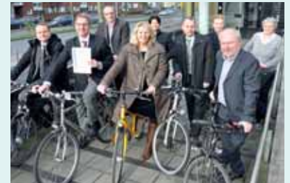
Die WFM ist einer der fahrradfreundlichsten Arbeitgeber Deutschlands.

Die Wirtschaftsförderung Münster GmbH belegt beim Wettbewerb „Fahrradfreundlichste Arbeitgeber Deutschlands“ den zweiten Platz. Der Bundesdeutsche Arbeitskreis für Umweltbewusstes Management (B.A.U.M.) und das Bundesverkehrsministerium loben die WFM für Klimaschutzende Aktionen. Dienstfahrräder stehen in überdachten Abstellplätzen kostenlos zur Verfügung, Mitarbeiter nutzen ihre Zweiräder bei Arbeitswegen und Dienstfahrten.