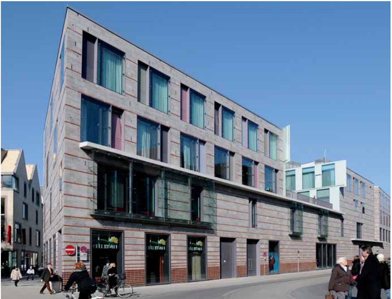
Ein Quartier mit Anziehungskraft: die Stubengasse.