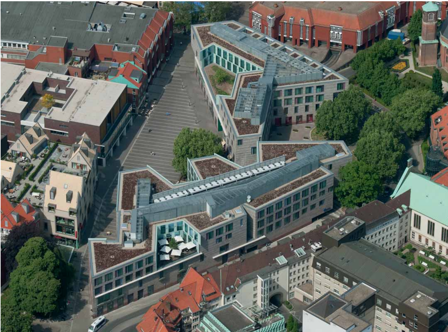
Der Einzelhandelsstandort Münster