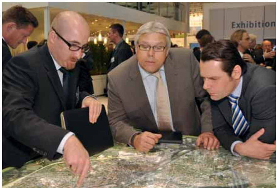
Zentrales Highlight mit Anziehungskraft: Auf der EXPO REAL 2010 präsentiert sich der Standort Münster aus der Vogelperspektive.