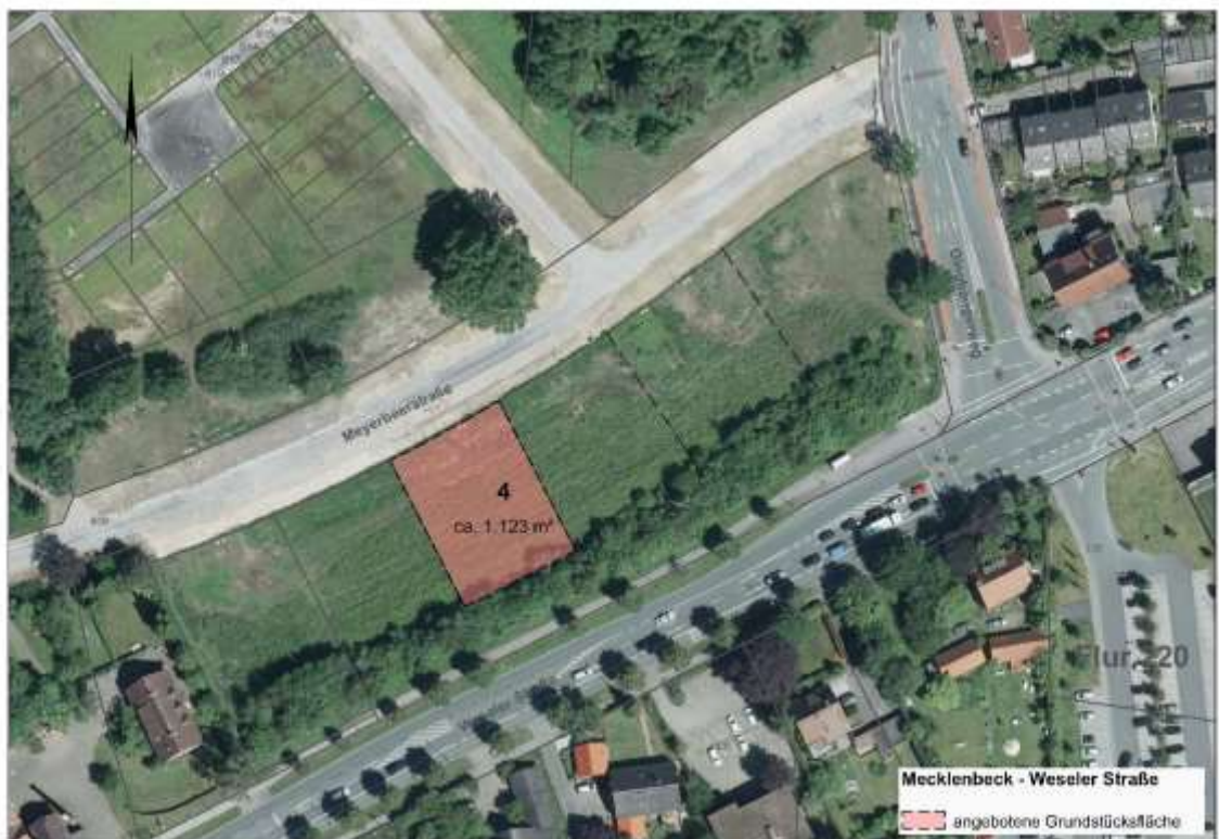
Auszug Luftbild Stadt Münster 2014 (ohne Maßstab)