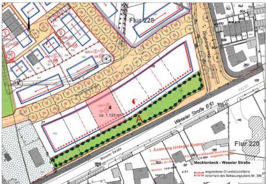
Ausschnitt Bebauungsplan (ohne Maßstab)